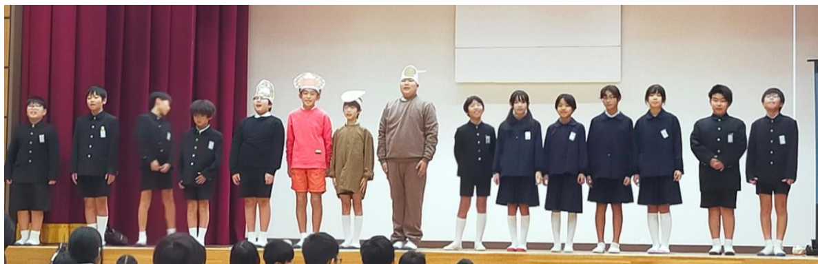
二島小学校の5年生が参加 学習発表会で劇や歌を披露