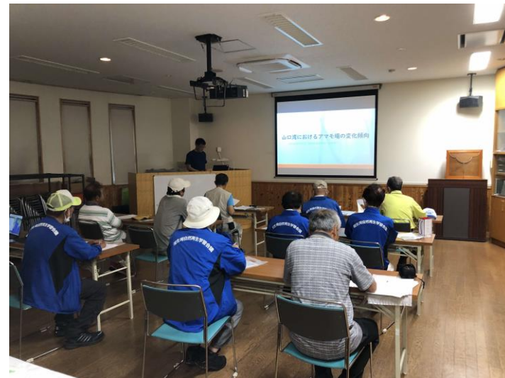
他団体からの視察