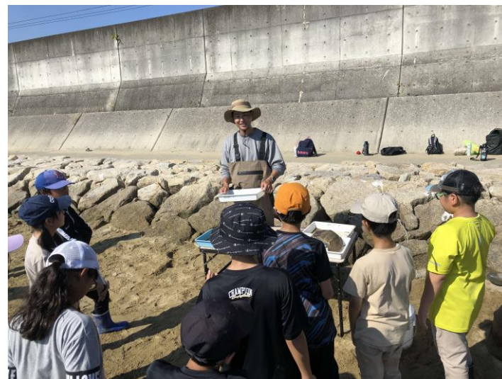
9/30水生生物観察（水産大学校）