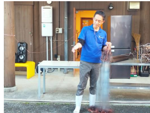
活動者による説明