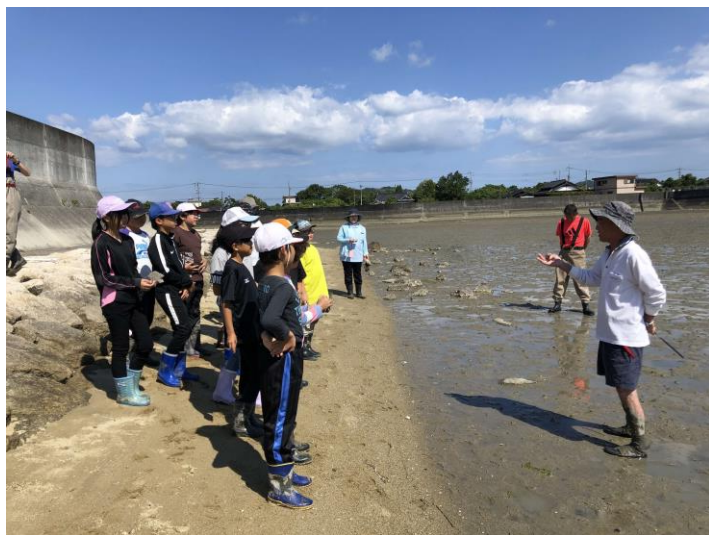
6/4カブトガニ等観察（カブトガニ研究懇話会）