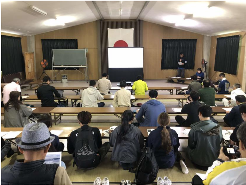
第36回協議会の様子