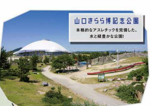
山口きらら博記念公園 本格的なアスレチックを完備した、水と緑豊かな公園！