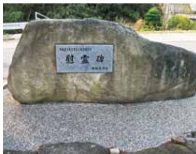
豪雨災害慰霊碑(防府市勝坂)

豪雨による土石流で4人の命が失われた下右田・勝坂地区では、災害から1年目の平成22年7月25日に、豪雨災害の犠牲者の遺志を永く後世へ伝えようと、勝坂自治会により国道262号線沿いに慰霊碑が建立された。