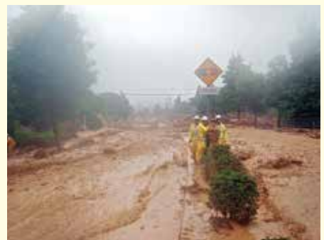
国道 262 号(防府市)

夕方近くになるとやっと雨は止んで、濁流も少しずつ引いて動ける状態になったので市内方面へ移動しました。結局、事務所へ着いたのが 18 時頃だったと思います。鏡で自分の姿を見たら泥だらけ、まるで田んぼの中でバレーボールでもしたような姿でした。