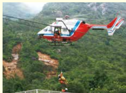
消防防災ヘリ「きらら」による救出

災害から1年目の平成22年7月25日には、豪雨災害の犠牲になられた4名の方々の遺志を永く後世へ伝えようと慰霊碑を建立し、慰霊祭式典を営んだ。 今回の災害は住民一人ひとりの心から永遠に消えることはない。これを契機に住民の絆を大切に、災害に負けない地域づくりに取り組んでいきたい。