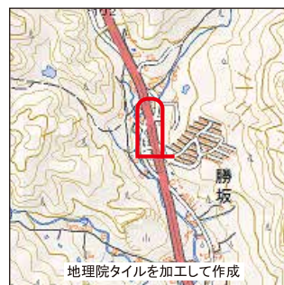
地理院タイルを加工して作成