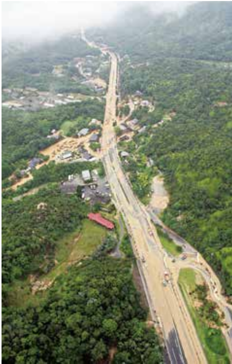
国道 262 号(防府市)