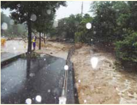
国道 262 号(防府市)

当時、私は防府土木建築事務所で道路維持管理の担当をしており、当日は朝から国道 262 号の現場にいて土石流を体験しました。