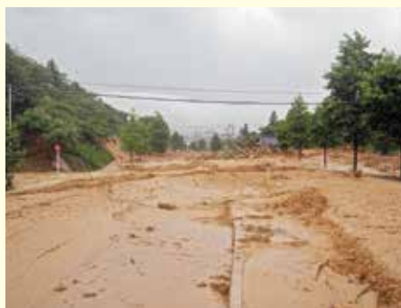
国道 262 号(防府市)

7月21日、前日からの雨脚はさらに強くなり、高台に位置する我が家から伺える周囲の景色が刻々と薄暗い雲域に変わっていくように見えた。