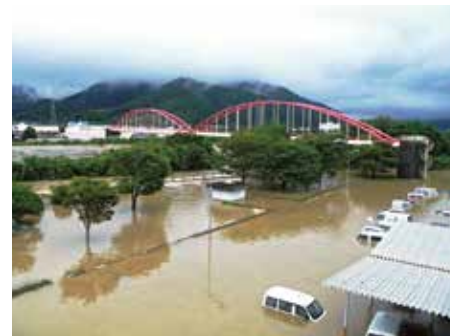
榎野川越流(山口市)