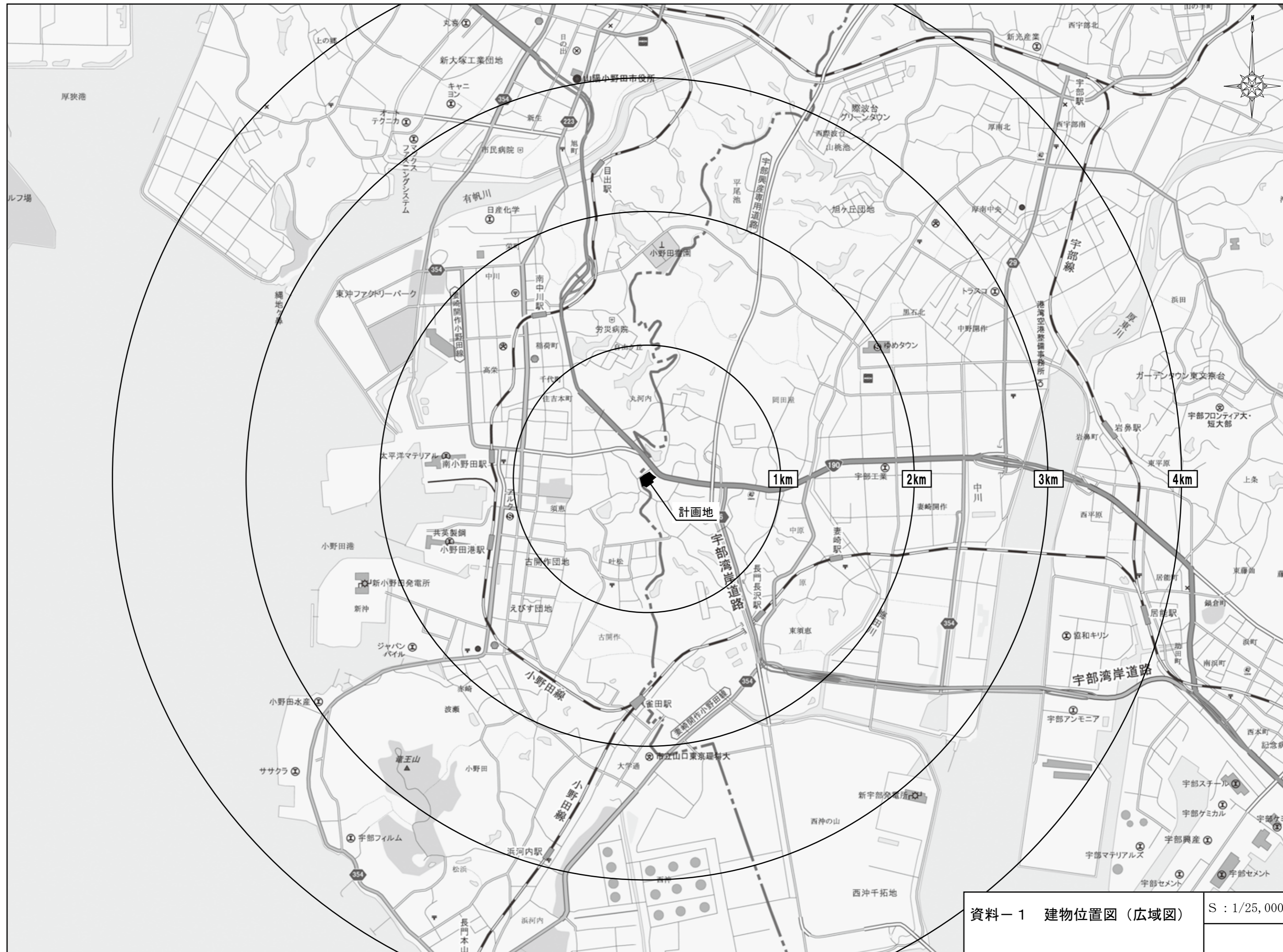
資料-1 建物位置図 (広域図)