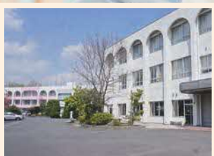
■ 学部(学科) ・ 幼児教育科