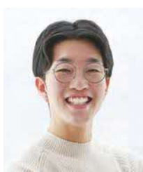
梅光学院大学 文学部人文学科 4年 えのもん先輩