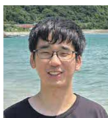
水産大学校 海洋機械工学科 4年 わっさん先輩