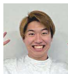
山陽小野田市立 山口東京理科大学 工学部電気工学科 3年 しゅん先輩