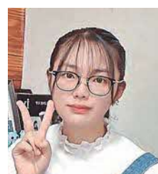
下関短期大学 栄養健康学科 1年 かえで先輩