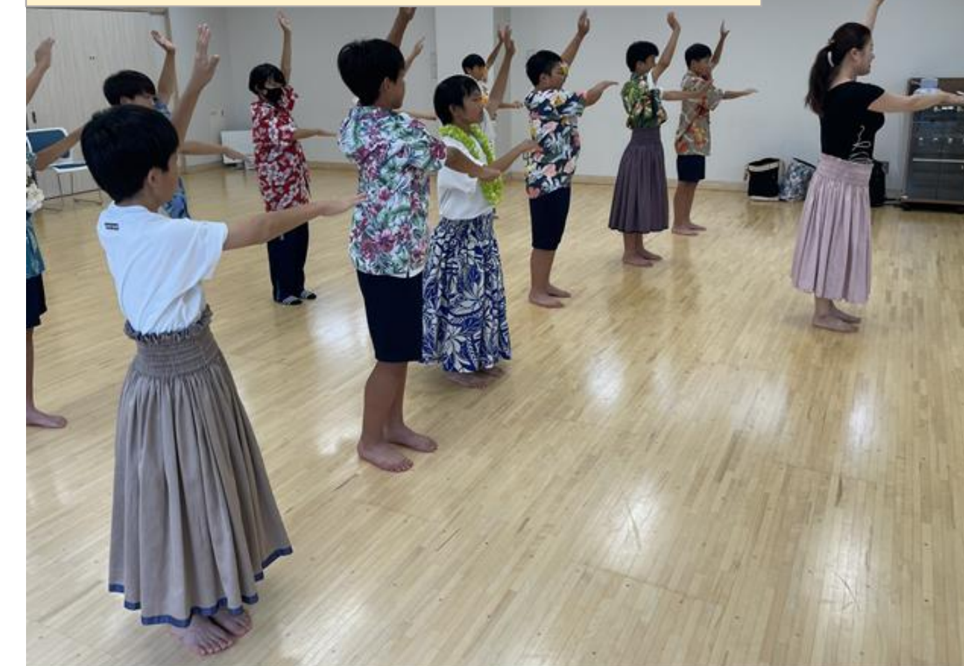
菊川で学び、活躍する日

生徒が地域の方と一緒にフラダンスや陶芸等を学ぶとともに、ボランティア等で活躍している。