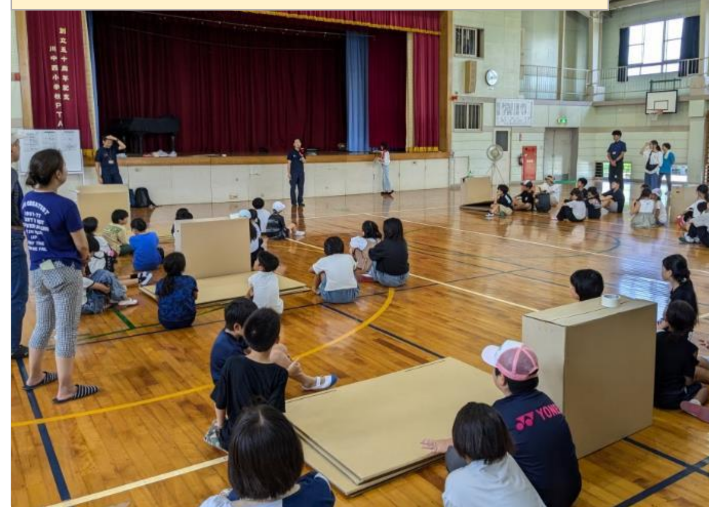
防災を通じた地域のつながり

地域全体で防災意識を高めるため、学校運営協議会主催で「夏休み防災デイキャンプ」を実施した。