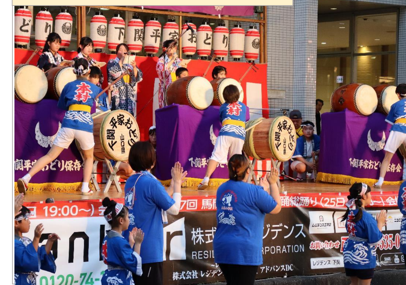
平家踊りで地域活性化