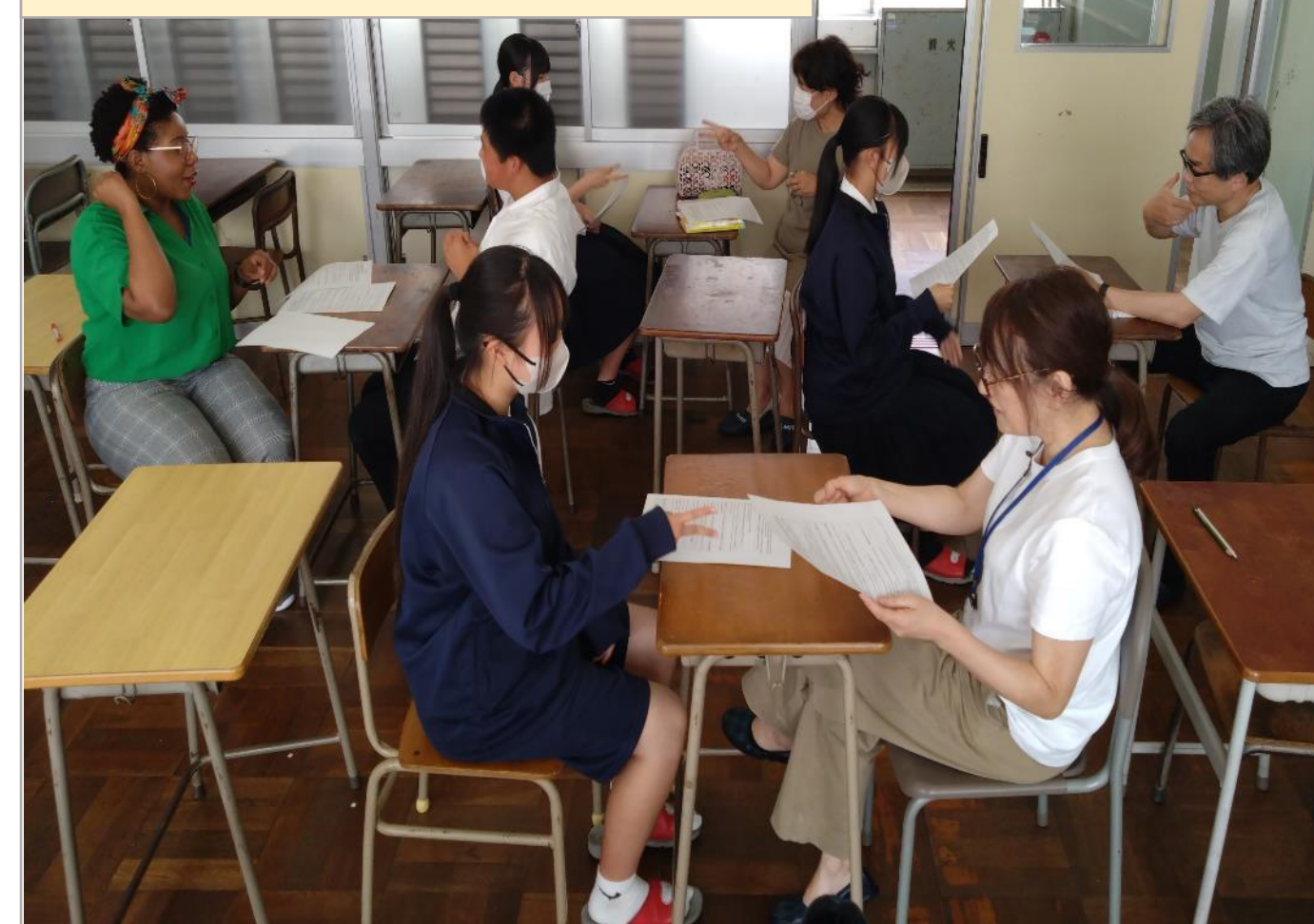
大人の学び場の創出

昼休みにALTによる英会話教室を開催。地域の方とともに自主的に中学生も参加している。