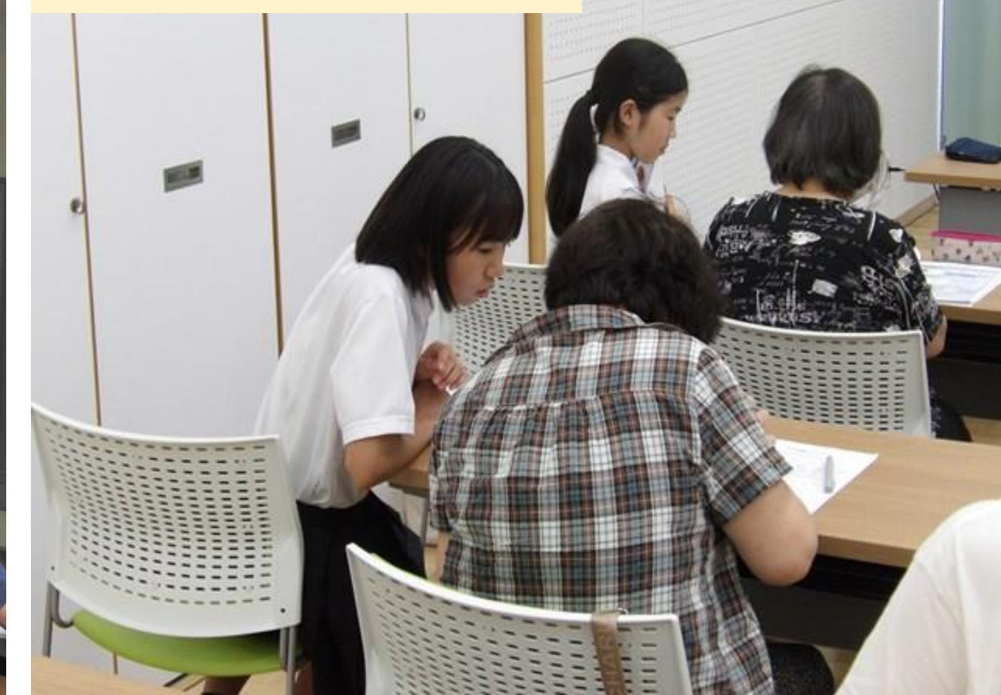
高齢者スマホ教室

シニアクラブ開催の「高齢者スマホ教室」で中学生が講師を手助け。優しい声かけと豊富な知識でサポート。