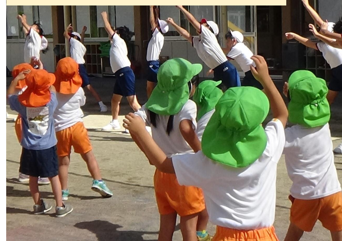
ラジオ体操による幼保小連携

昨年度「全国小学校ラジオ体操コンクール」で総務大臣賞を受賞。ラジオ体操による幼保小連携の活性化。