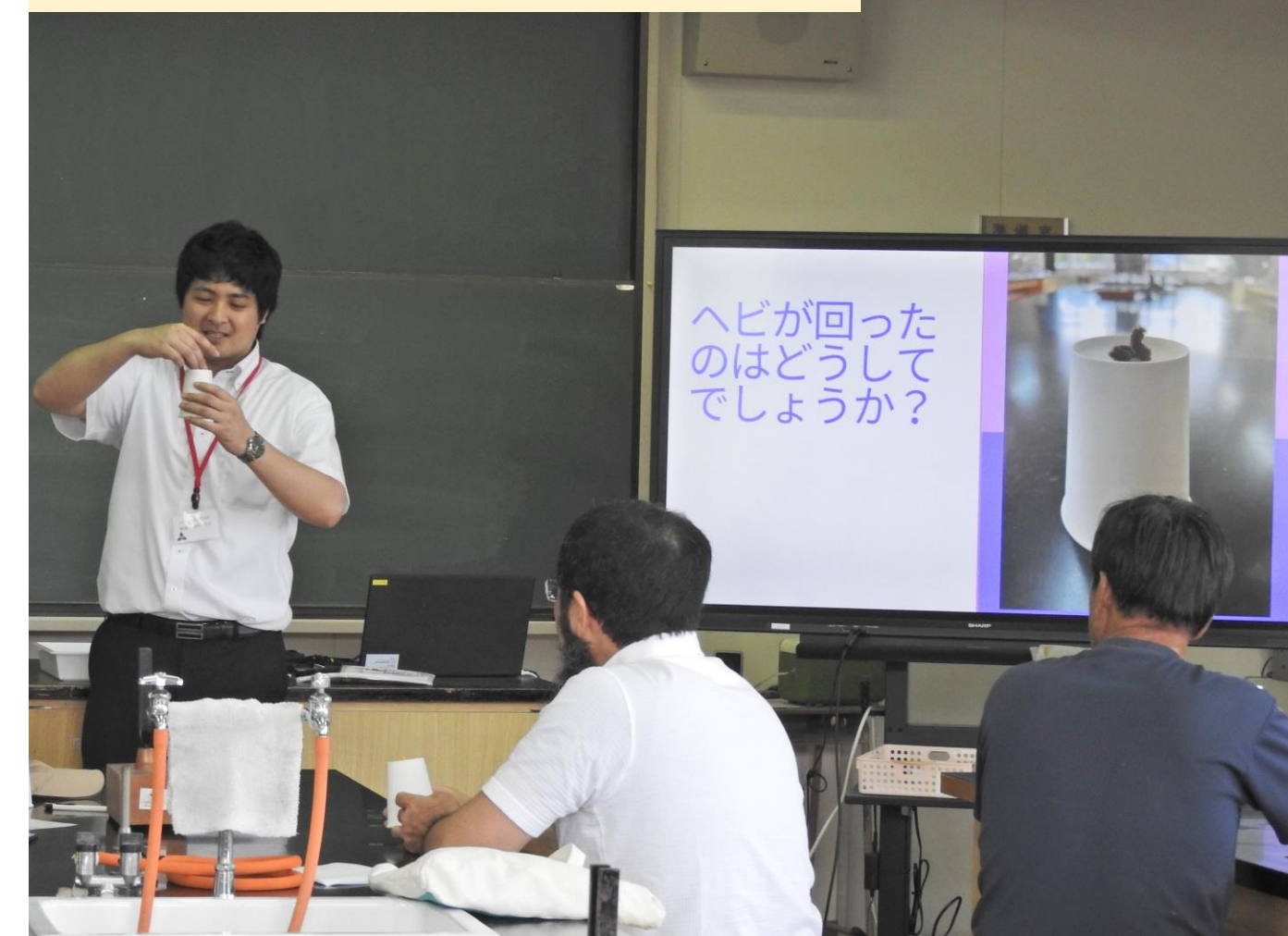
阿東中オープンデー

「阿東中オープンデー」で生徒企画のカフェや総合学習の成果発表。教員による地域住民への授業も実施。