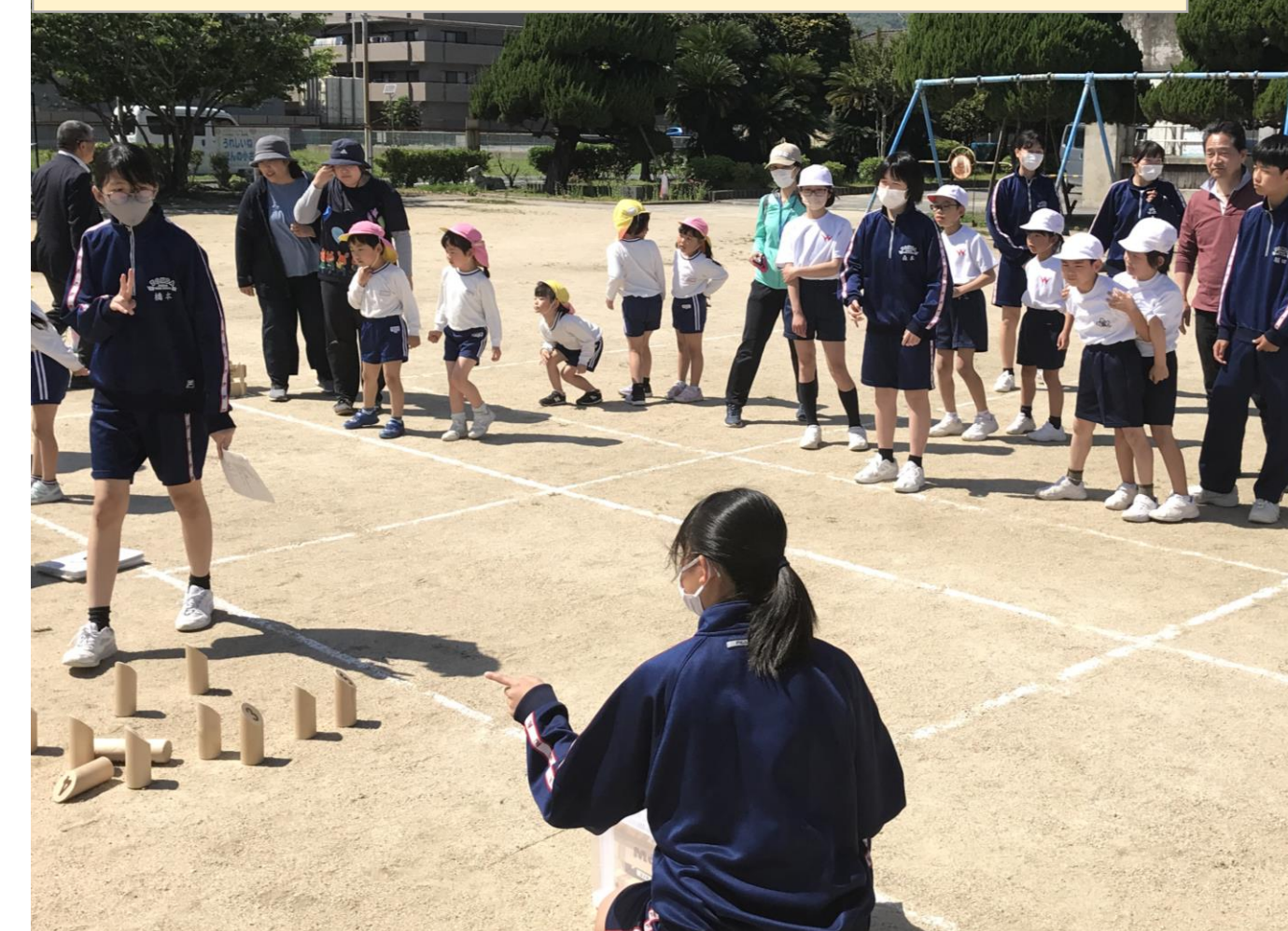
小中地域合同モルック大会

中学2年生が企画・運営し、小学3年生や地域住民、幼稚園児と一緒に大会を楽しんだ。