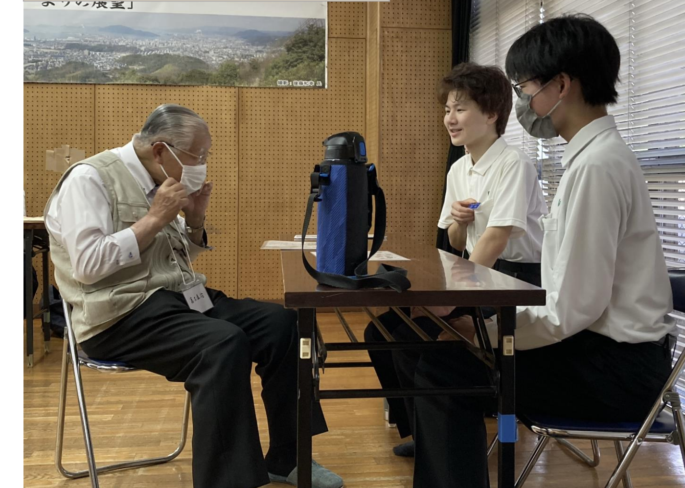
しゅうようトーク

生徒と地域住民が語り合い、生徒自身のキャリア形成や地域への愛着を高めることにつながった。