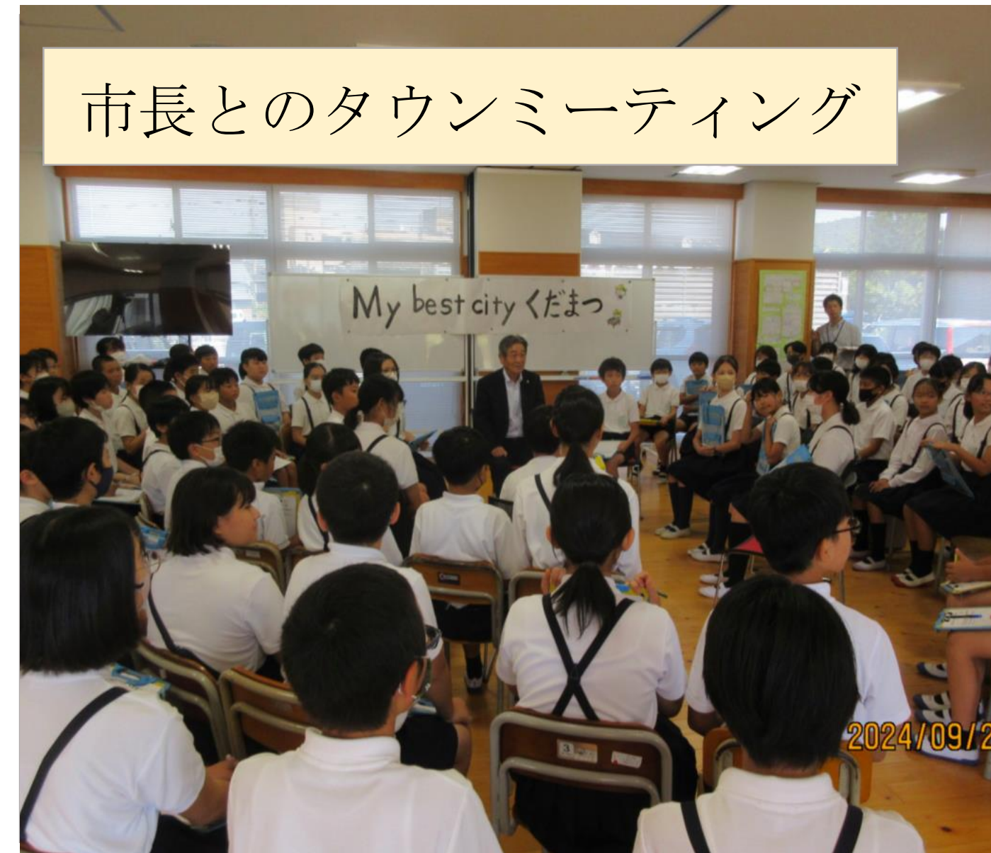
市長とのタウンミーティング

6年生児童が、市の魅力や課題を整理し、未来の下松市について市長と意見交換をした。