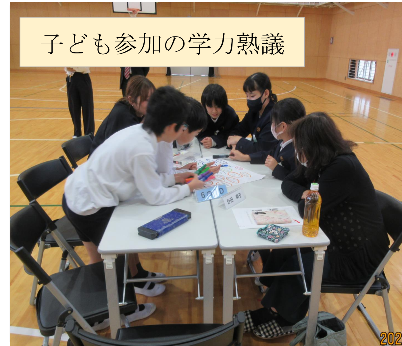
子ども参加の学力熟議