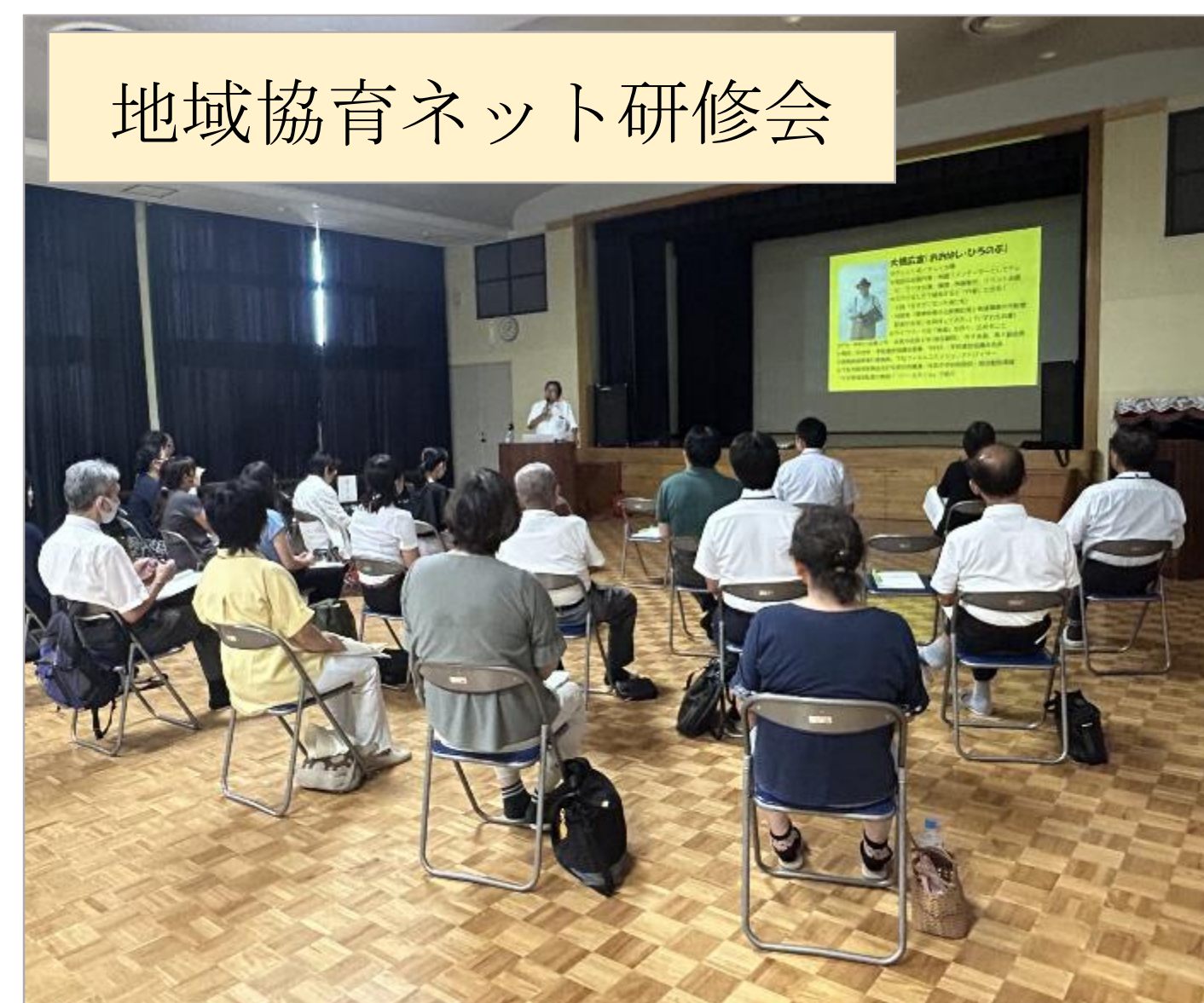
地域協育ネット研修会

「ふるさとを愛し、未来の創り手となる人」を育むシンポジウムを開催し、語り合った。