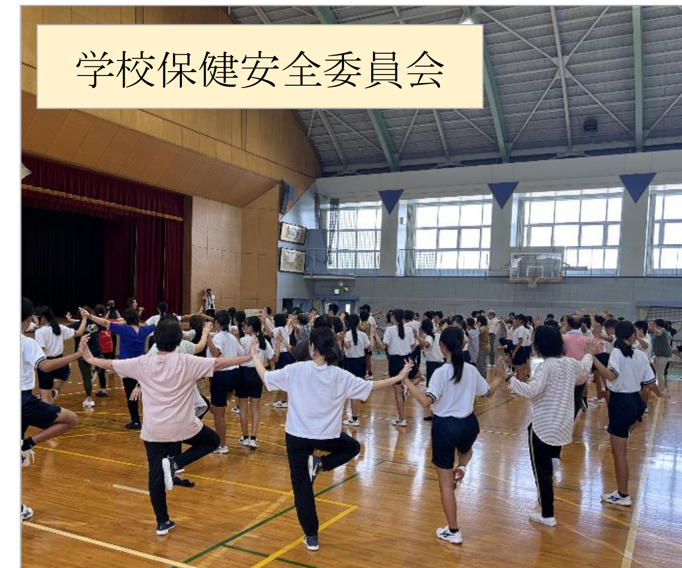
学校保健安全委員会

生徒が企画・運営し、町長や多くの保護者、地域の方と一緒に、講師の方から体づくりについて学んだ。