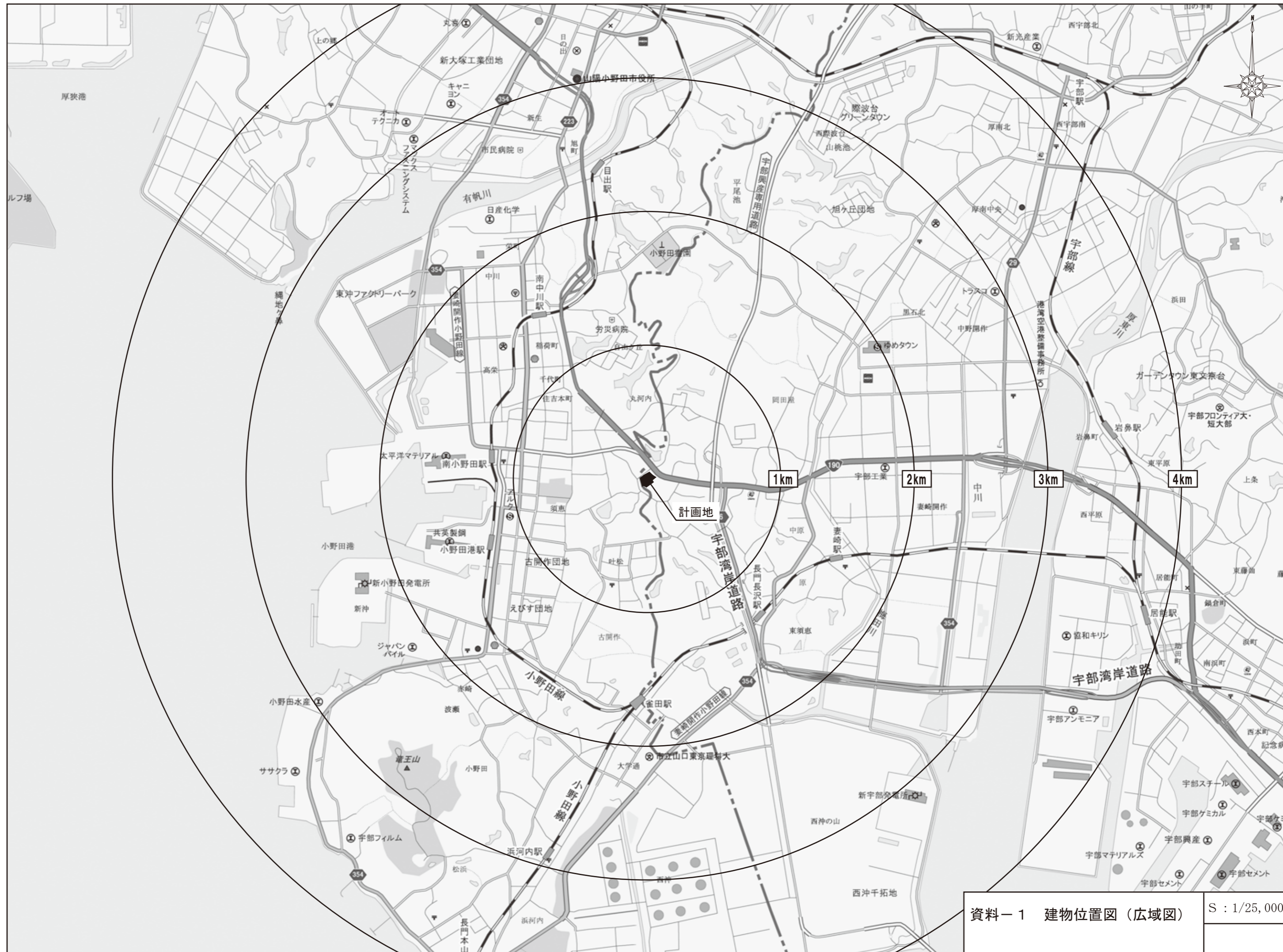
資料-1 建物位置図 (広域図)