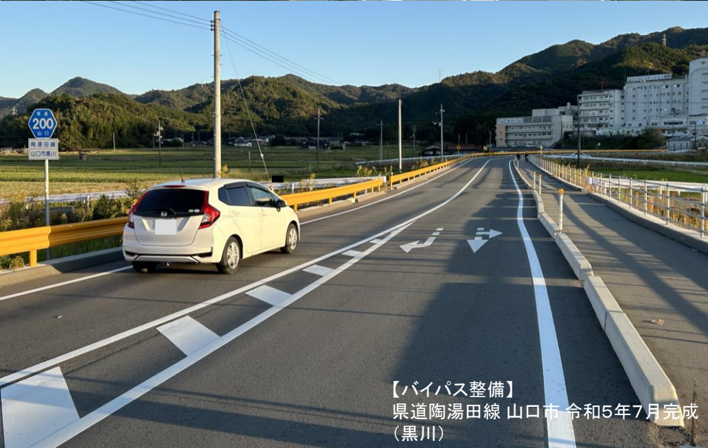
【バイパス整備】 県道陶湯田線 山口市 令和5年7月完成 (黒川)