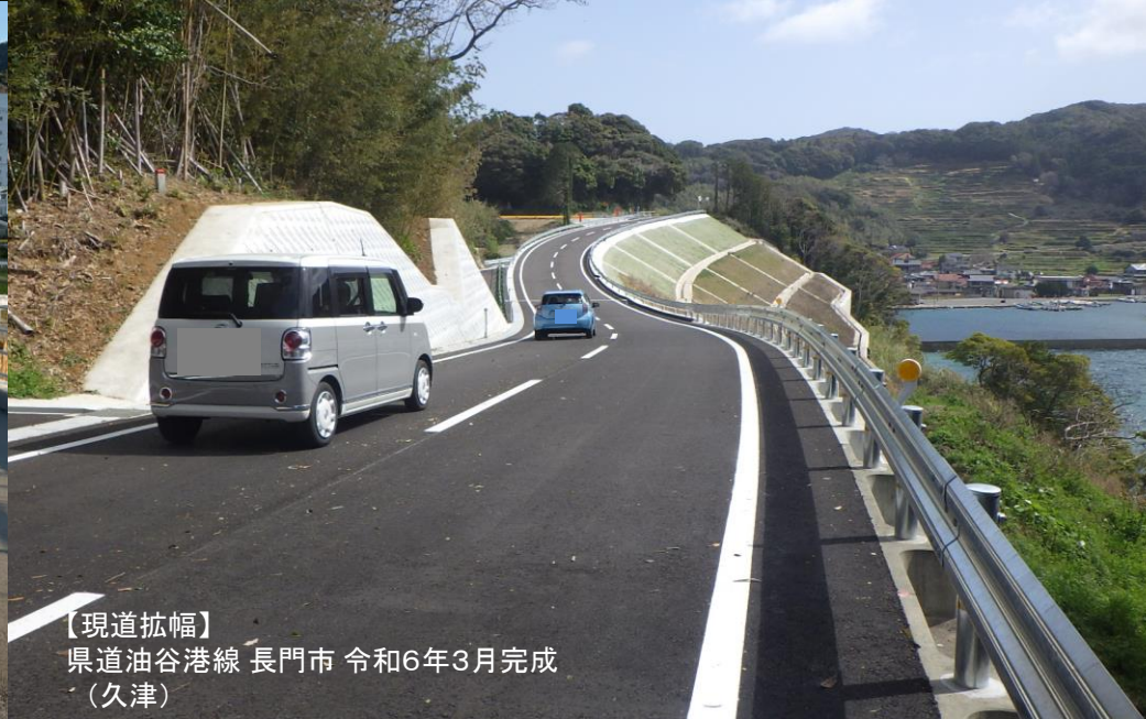
【現道拡幅】 県道油谷港線 長門市 令和6年3月完成 (久津)