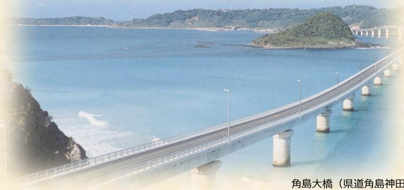
角島大橋（県道角島神田線）