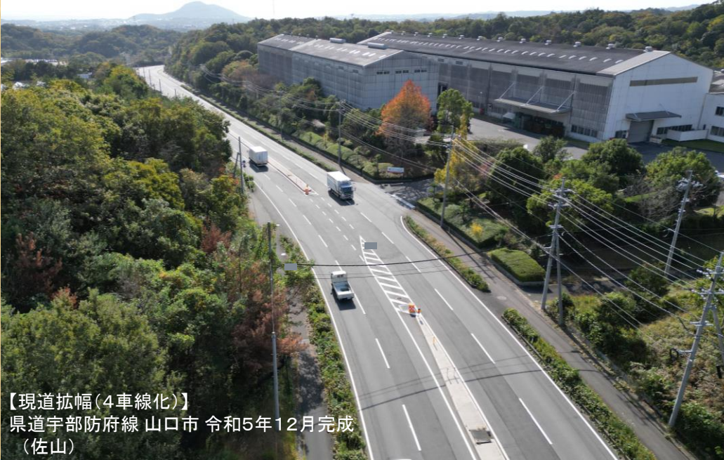
【現道拡幅(4車線化)】 県道宇部防府線 山口市 令和5年12月完成 (佐山)