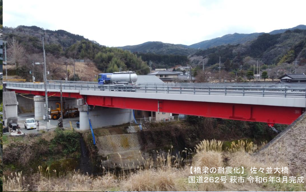
【橋梁の耐震化】佐々並大橋 国道262号 萩市 令和6年3月完成