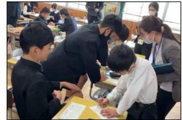
【学び方を選択して学ぶ様子】