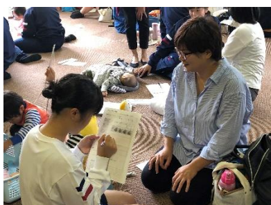
[子育て体験の聞き取り調査]