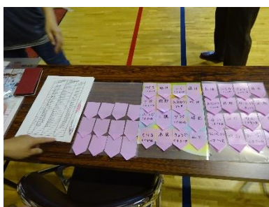
[受付 (名簿/名札シール)] [会場 (マット/おもちゃ/壁飾り)]