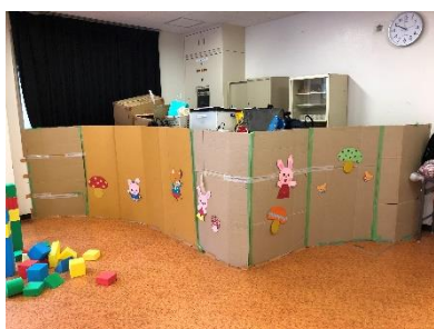
[安全対策 (危険物カバー)] [おむつ替え/授乳室 (会場内)] [おむつ替え/授乳室 (別室)]