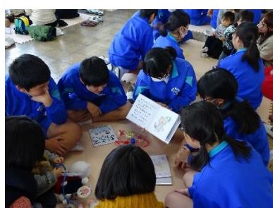
[手作り絵本の読み聞かせ]