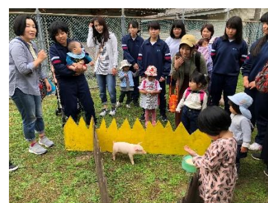
[動物との触れ合い体験]