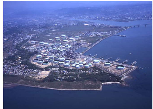
西部石油株式会社山陽小野田事業所 全景

また、山口製油所は、各種の精製装置が集約・連結された集中合理化設備を装備しており、最新のコンピュータ制御による自動運転や最適効率の生産で、省エネルギーに取り組んでいます。