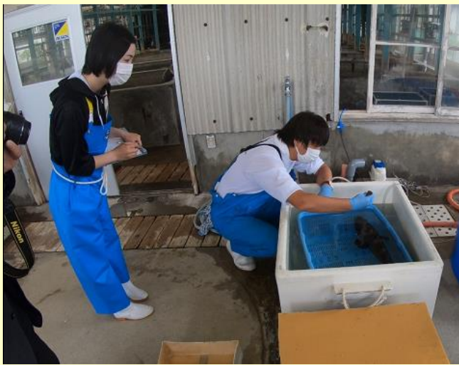
クエに麻酔をかけているところ

今般、クエの腹腔内に、記録計を装着し、本県日本海側に放流しましたので、ご紹介します。