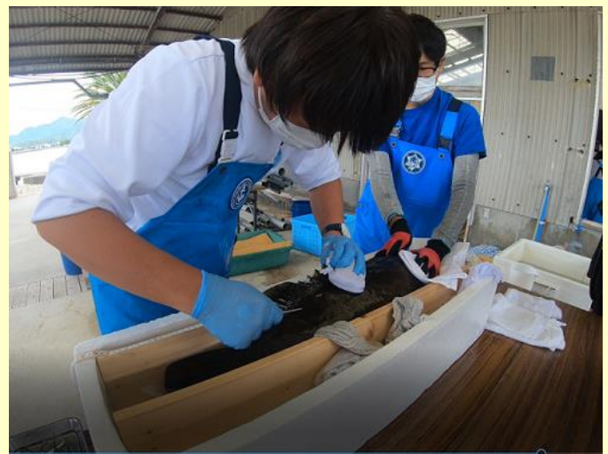
第2背ビレ左右基部にダートタグ装着