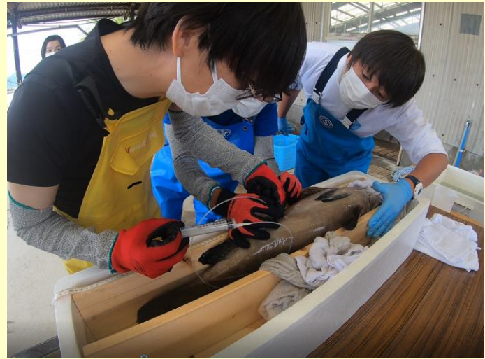
生殖巣にチューブを挿入して性別確認