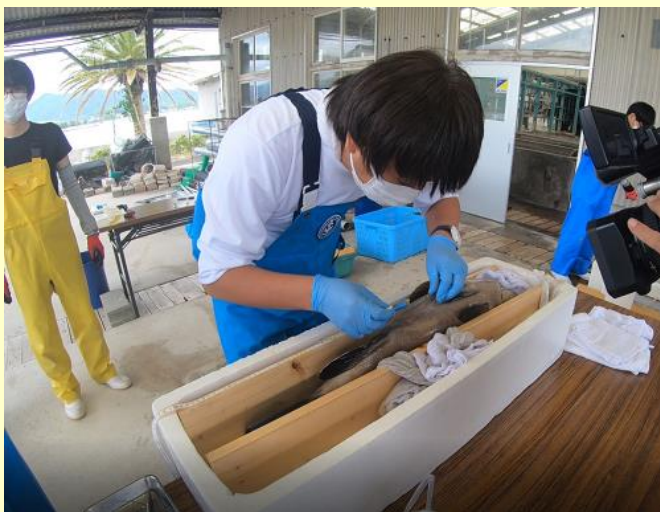
腹部を切開し、記録計を挿入、縫合。