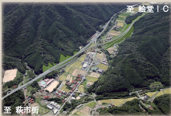
(仮) 明木IC付近完成予想図 ～明木地区上空より絵堂方面を望む～