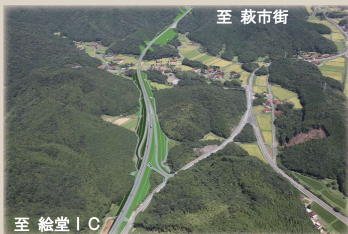
(仮) 絵堂北IC付近完成予想図 ～絵堂IC上空より萩方面を望む～