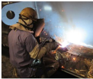
溶接をする姿は“職人”そのもの