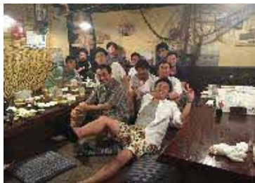
職場の懇親会の様子

私自身、就職活動をする際は、給与や休日、福利厚生やネームバリューで就職先を決めようとしていました。 そうすると、自然と大手企業が視野に入ってきましたが、自分の将来をちょっとだけ真剣に考えてみると、「自分の技術を生かせる仕事をしたい」や「人数の多い大手企業の中で仕事をするより、自分から何か進める事ができる環境で仕事をしてみたい」といった考えが生まれました。 鋼板工業は、自分が学んだ技術を活かせることや自分から進んで仕事ができる環境であることから、自分にあった会社だと感じています。 自分が将来、何がやりたいかは直ぐに見つからないと思いますが、ちょっとでも気になることややってみたいと思うことがあれば、それが出来る環境を探して、そこに就職してみるのも良いかもしれません。