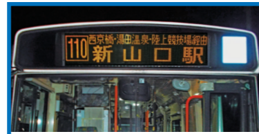
巴士車頭上方的終站標識