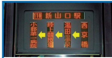
巴士車身的終站標識