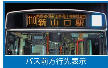
バス前方行先表示