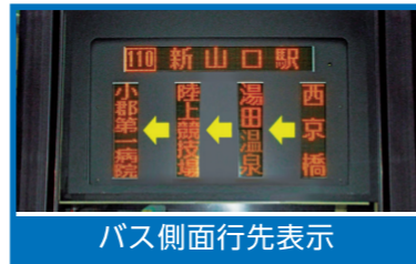
バス側面行先表示