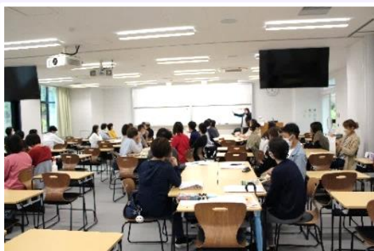
グループ演習では、アウトブレイク発生時の対応についてシミュレーションしました。(昨年度の様子)

通所サービスも含む高齢者保健福祉施設における感染対策の基本的知識や高齢者施設で多発する感染症に応じた対策の実際を学びます。また、新型コロナウイルス感染症を含む高齢者施設で多発する感染症を防止するための平常時の対策及び発生時の対応についてシミュレーション演習を行います。