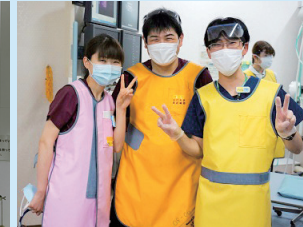
▲呼吸器・感染症内科