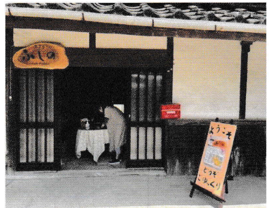
カフェふしの地図