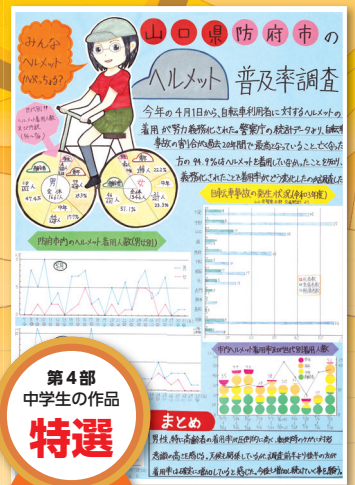
第4部 中学生の作品 特選