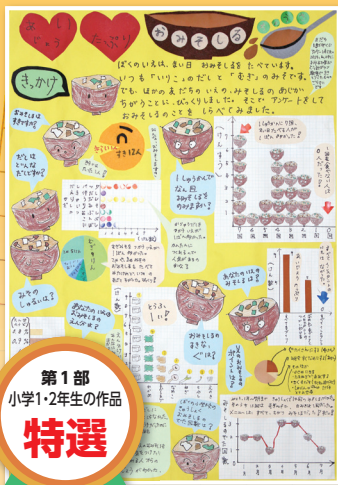
第1部 小学1・2年生の作品 特選