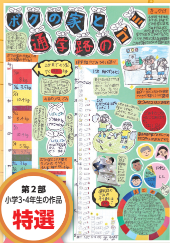
第2部 小学3・4年生の作品 特選