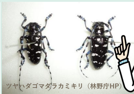
ツヤハダゴマダラカミキリ（林野庁HP）

樹木医は、天然記念物のような巨樹から、街路樹などの身近な樹木まで、傷んだり病気になった樹木の診断と回復、病気の予防や保護・育成に関わる専門家です。