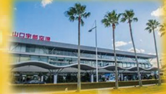
山口宇部空港 (宇部市)