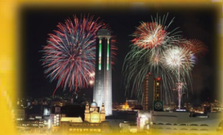
関門海峡花火大会 (下関市)