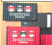
伝統工芸柳井縞のカードケース

専門高校等の生徒が学科の枠を越え協働して模擬会社を設立し、一連の起業体験や商標の考案を行うなど、新たな価値を創造する教育を展開