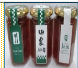
果物を加工したジャム