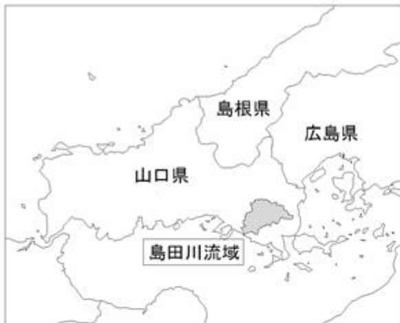
付図1 洪水予報区間及び雨量・水位観測所位置図