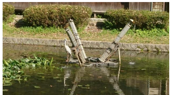
周南緑地公園（西緑地）内 コウホネの池