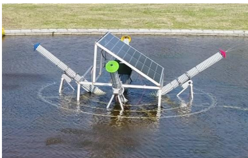
山口きらら博記念公園 いのちの池