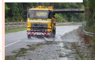
高速道路における降雨対策