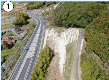
① 絵堂 I C 付近