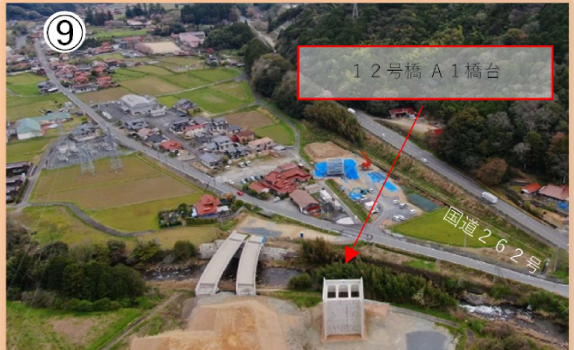
⑨ (仮)明木 I C 付近