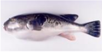
トラフグ(日本海・東シナ海・瀬戸内海系群)