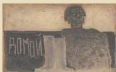
香月泰男(ダモイ)1959年 油彩・方解末・木炭 /カンヴァス 山口県立美術館蔵

※当選者の発表は、発送をもって代えさせていただきます。 ※プレゼントの発送は、2024年5月末を予定しています。