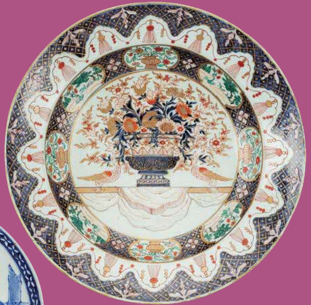
色絵花盆文大皿 肥前 有田 江戸時代中期(17世紀末～18世紀中頃) 兵庫陶芸美術館蔵