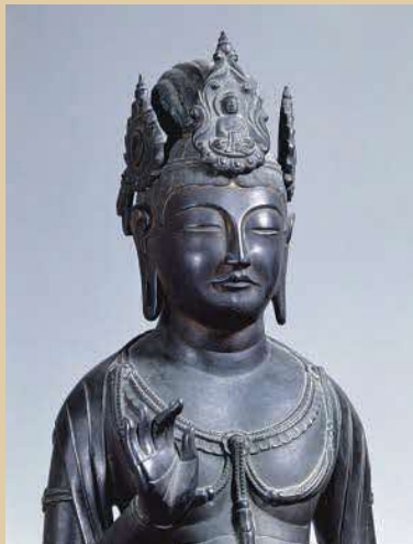
国宝《観音菩薩立像[夢違観音]》(部分) 法隆寺蔵