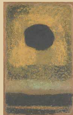
《黒い太陽》1961年 油彩・方解末・木炭/カンヴァス 山口県立美術館蔵