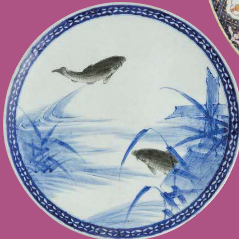
釉下彩鯉文大皿 佐賀 有田 明治時代(19世紀後半～20世紀初頭) 兵庫陶芸美術館蔵

兵庫陶芸美術館所蔵 赤木清士コレクション 古伊万里のモダン —華麗なるうつわの世界— 4/27日 ▶ 6/23日