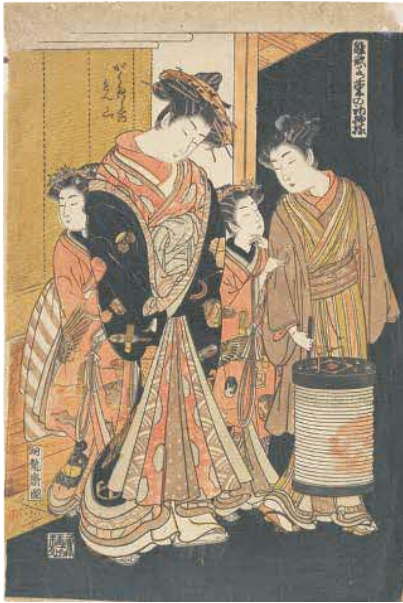
磯田湖龍齋「雛形若菜の初模様 かくたはらや内れん山」 安永5年(1776年)頃