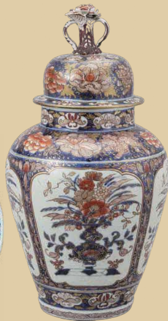
色絵花盆文蓋付大壺 肥前 有田 江戸時代中期(18世紀初頭～中頃) 兵庫陶芸美術館蔵

日本最初の磁器である伊万里焼は、17世紀初頭に肥前有田(佐賀県有田町)で生産が始まります(江戸時代に生産された伊万里焼は「古伊万里」と呼ばれます)。半世紀後には欧州に輸出され大変な人気を博し、17世紀末には国内外に「古伊万里」のブランドを決定づけた豪華絢爛な古伊万里金襴手様式が現れました。18世紀半ばになると海外輸出も終焉をむかえ国内市場に目を向けた伊万里焼は、同時代の多様な好みや変化を敏感に捉えながら、時代の流行を追い求め、その姿を変えていきます。さらに、明治維新を経て、近代国家へ生まれ変わろうとする動きの中で、磁器についても西欧近代の新しい素材や技術が取り入れられました。本展覧会では、時代の変化を敏感に捉え、モダンに生まれ変わっていく「古伊万里」を中心に、明治以降の伊万里焼も含めた約100件の作品でその魅力に迫ります。