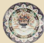
色絵花盆文大皿 肥前 有田 江戸時代中期 (17世紀末~18世紀中頃)、兵庫陶芸美術館蔵