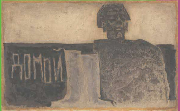
香月泰男《タモイ》 1959年 油彩・方解末・木炭／カンヴァス 山口県立美術館蔵