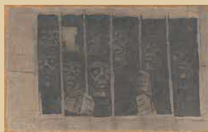
《北へ西へ》1959年 油彩・方解末・木炭/カンヴァス 山口県立美術館蔵