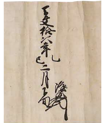
写真2「御馬書」の隆元署名部分