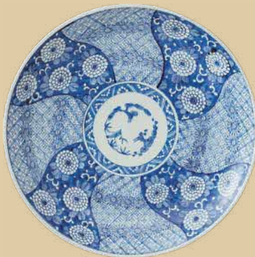
染付松竹梅菊捨花文大皿 肥前 有田 江戸時代後期(19世紀初頭～中頃) 兵庫陶芸美術館蔵

※( )は前売りおよび20名以上の団体料金。 ※高等学校、中等教育学校、特別支援学校の生徒は無料。 ※障害者手帳等をご持参の方とその介護の方1名は無料。 ※前売券は、ローソンチケット(Lコード:62430)、セブンチケットでお求めになります。 ※開催中のコレクション展示もご覧いただけます。