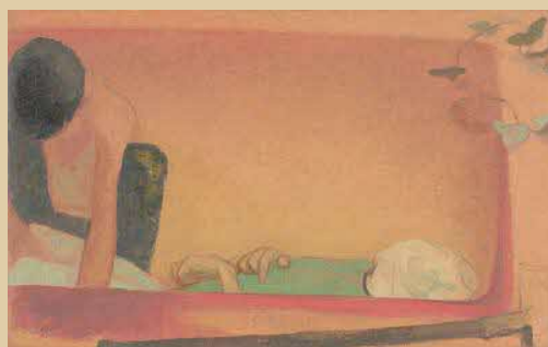
《埋葬》1948年 油彩/カンヴァス 山口県立美術館蔵

長門市三隅に生まれ、太平洋戦争を挟む激動の時代を生きた画家、香月泰男(1911-74)。新進気鋭の画家として頭角を現し始めた矢先に届いた召集令状は、香月の行く末を大きく変えました。太平洋戦争への従軍、そして戦後のシベリア抑留。戦後、復員した香月は、やがて黒と黄土色を基調とする独特の画面に、過酷な体験を一つまたひとつと描いていきます。今日「シベリア・シリーズ」と呼ばれるそれらの作品群によって、香月は画壇に確かな地歩を占めました。本展は、画家の没後50年を記念して、代表作の「シベリア・シリーズ」全57点を一堂に展示します。5年振りとなる同シリーズ全点公開に加えて、準備素描などの資料も併せてご覧いただき、香月が体験した戦争と抑留、そして創作活動の軌跡をたどります。