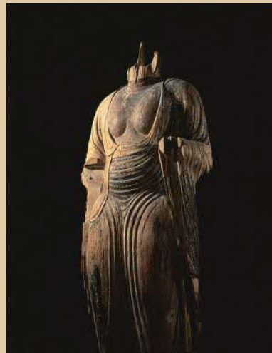
重要文化財《如来形立像[トルソー]》(部分) 唐招提寺蔵

穏やかな自然に生まれ、悠久の歴史と物語を秘めた「奈良大和路」。はるか1400年の昔から数多くの寺院が建立されたこの地には、静かな慈愛に満ちた「みほとけ」が伝えられています。