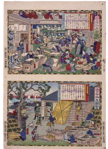
三代歌川広重 「大日本物産図会 東京錦絵製造之図」 武蔵国浅草海苔製図」 明治10年(1877年)