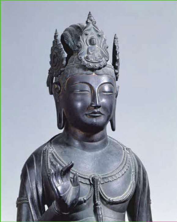
国宝《観音菩薩立像〔夢違観音〕》(部分) 法隆寺蔵