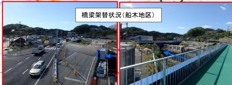
橋梁架替状況(船木地区)