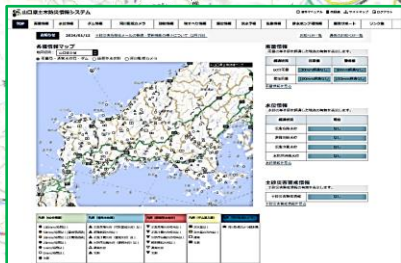
山口県土木防災情報システム