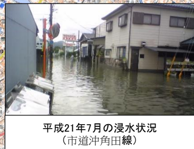
平成21年7月の浸水状況 (市道沖角田線)