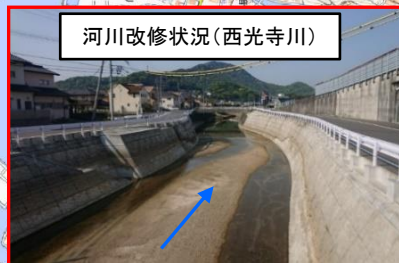
河川改修状況(西光寺川)