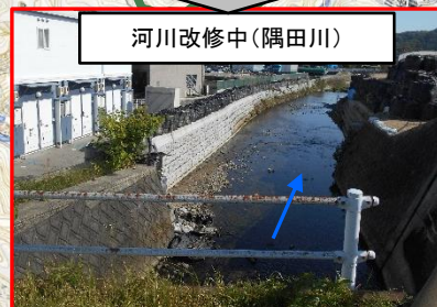
河川改修中(偶田川)