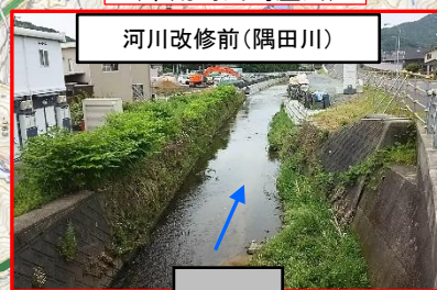
河川改修前(偶田川)