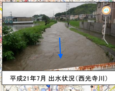
平成21年7月 出水状況(西光寺川)