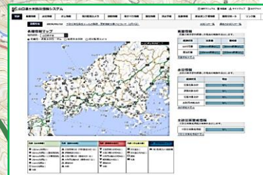
山口県土木防災情報システム