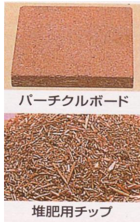
パーティクルボード

解体工事や伐採により発生する木くずを選別・破碎した製品です。木質チップは、木質ボード原料をはじめとして幅広い用途に活用されます。