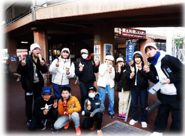
道の駅でソフトクリーム