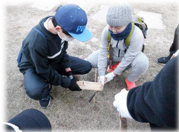
薪割りにチャレンジ