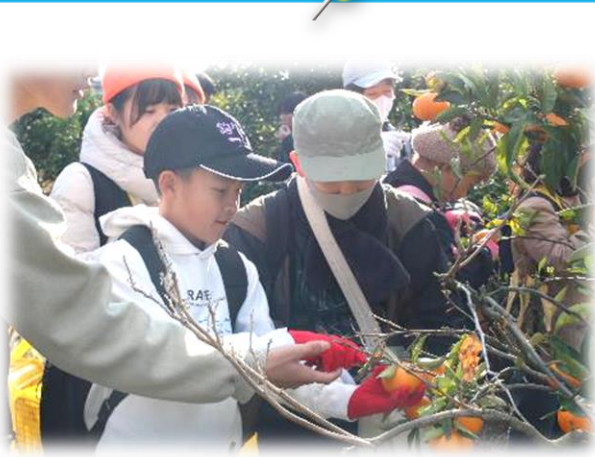
みかんの収穫体験