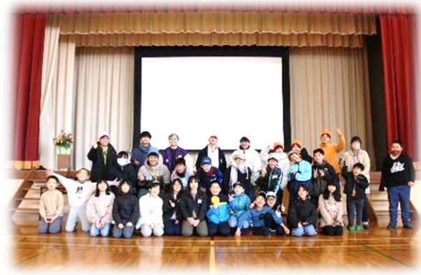
全員でハイ、チーズ