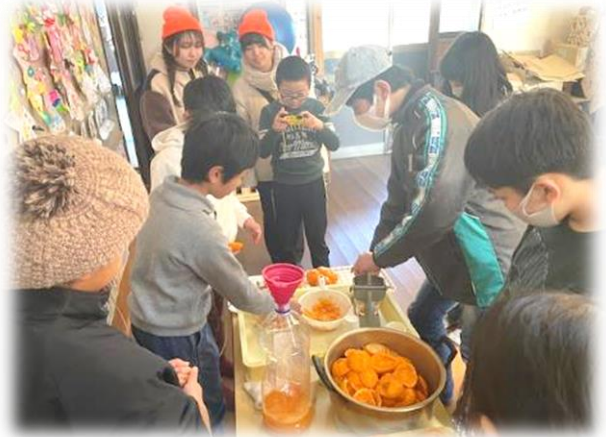
みかんジュース作り