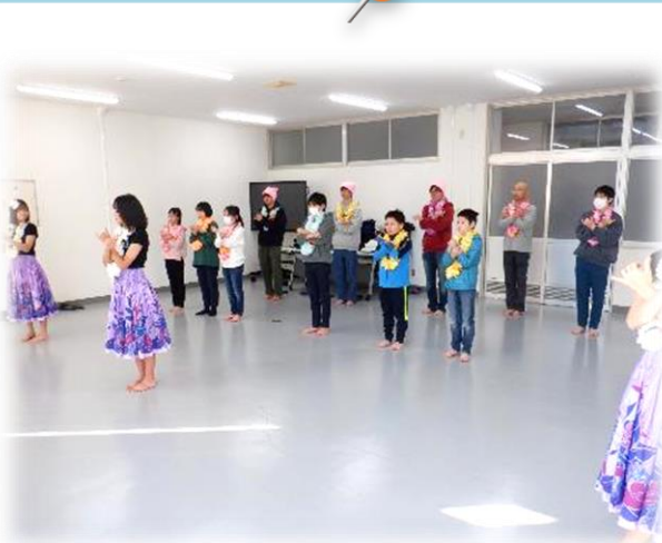
フラダンスレッスン