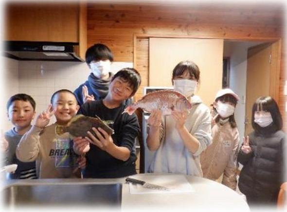
みかん鍋調理に挑戦