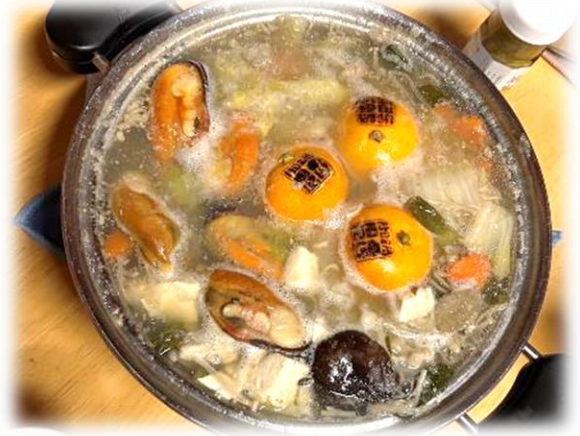
出来上がったみかん鍋