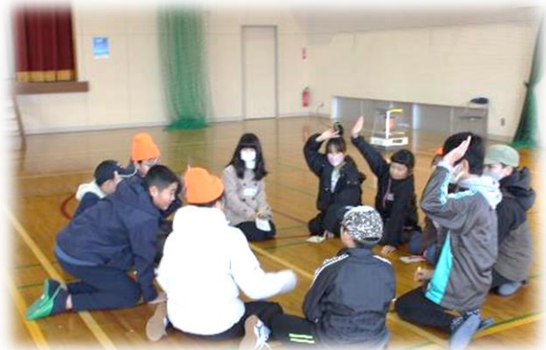
仲間づくりの活動