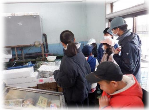
みかん鍋の食材探し