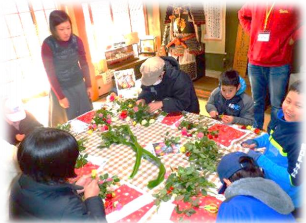
オリジナルレイ作り