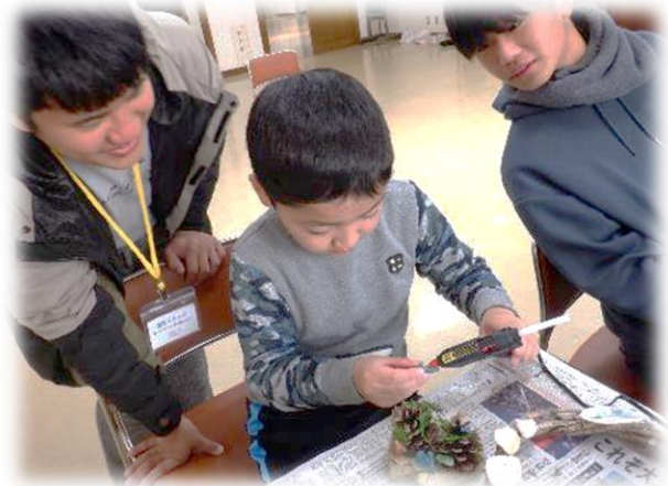
集めた素材でリース作り