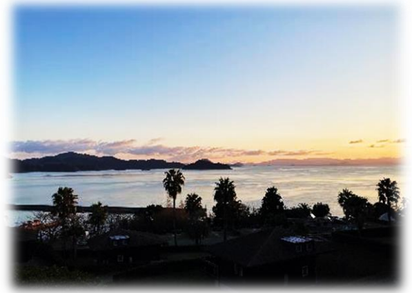
コテージの窓から