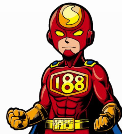
《県民生活課：188(いやや)マン》