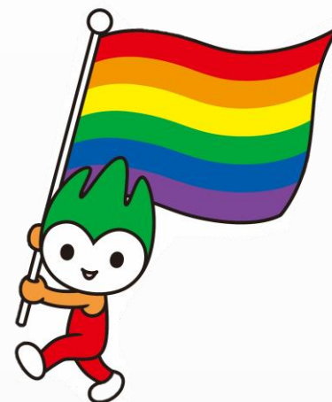
《男女共同参画課：レインボーフラッグちよるる》