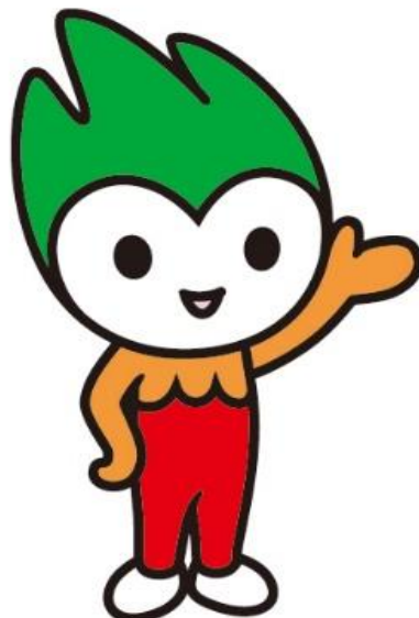
消費者教育推進大使 ちよるる