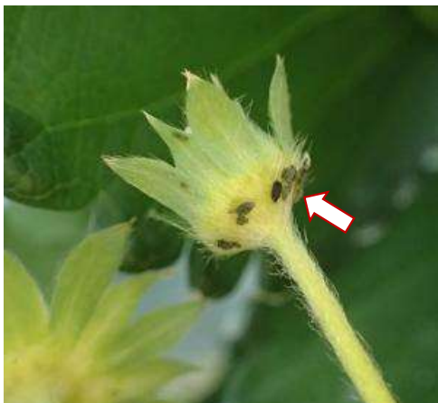
写真1 イチゴの花蕾に寄生するワタアブラムシ