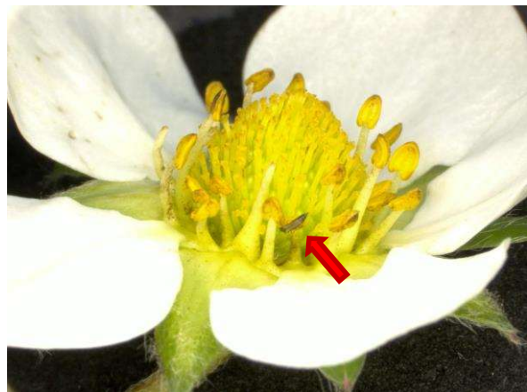
写真2 イチゴの花に寄生するヒラズハナアザミウマ