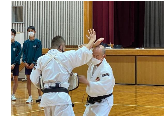
【講師によるオリエンテーション】