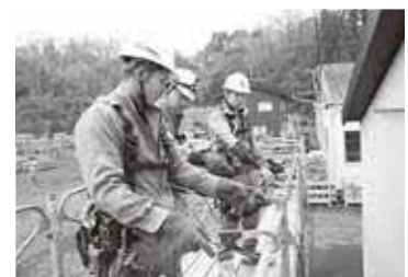
【指先込める安全の願い】

これからも、義勇の精神を持った、とび技能士を育成する事で、多くの若者が夢を実現していける力を身に付けられるよう応援したいと考えています。