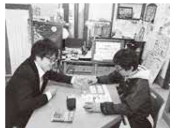
事業所での相談対応の様子

商工会は「商工会法(昭和35年制定)」という法律に基づいて設立された特別認可法人です。「経営に関するまちのお医者さん」として、地域の事業者が抱える様々な悩みに対して解決策の提案などを行っています。また、経済活動を通じて地域に「にぎわい」を作り出し、元気な地域づくりと商工業発展のための活動も行っています。日本の全企業の約86%は小規模事業者が占めています。そのような日本経済を支えている小規模事業者を支援する商工会の仕事はとても有意義でやりがいのある仕事です。