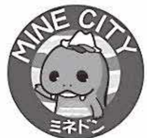
美祢市公式キャラクター

美祢市に住み、一緒に知恵を絞って市の未来を考え、市の将来を築く意欲ある若者を待っています。