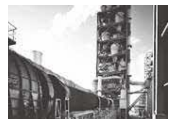
ロータリーキルン

当社は宇部興産の機械部門として発展してきた会社です。「いいものを世界に」を企業理念に大型製品の産業機械を製造しています。事業は設計・製造・アフターサービスまで一貫して行っております。製品はお客様の要望に応じて仕様を変えてオンリーワンの製品づくりを行っています。当社の技術で生み出される製品は世界中の産業を支えています。2020年8月にU-MHIプラテックと合併し、両社の技術を融合し、更なる事業展開を目指しています。