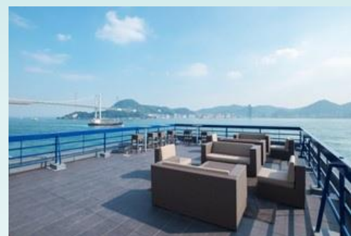
【テレワーク】uzuhouse