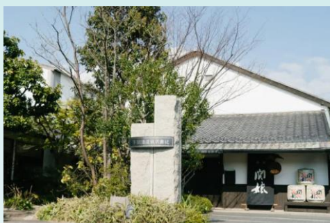
【1日目】下関酒造(外観)