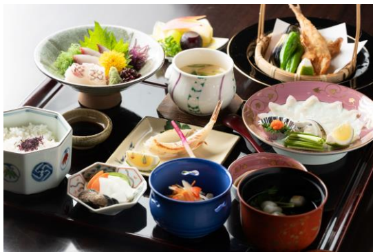
【2日目昼食イメージ】安岡ねぎを薬味として使用したふく刺しや焼きふく、小さく唐揚げなど下関を代表するふくメニュー満載の「ふくミニランチ」をお楽しみくださいませ