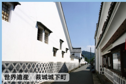
世界遺産 萩城城下町