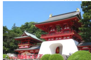
左:みもすそ川公園 右:赤間神宮