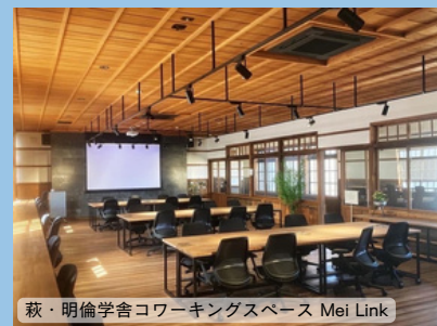
萩・明倫学舎コワーキングスペース Mei Link