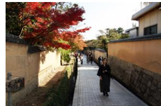
左:長府庭園 右:城下町長府(イメージ)