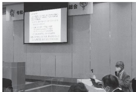
[取組事例の発表（山口せわやきネットワーク）]