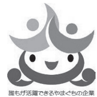
誰もが活躍できるやまぐちの企業