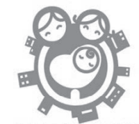
やまぐち子育て応援企業