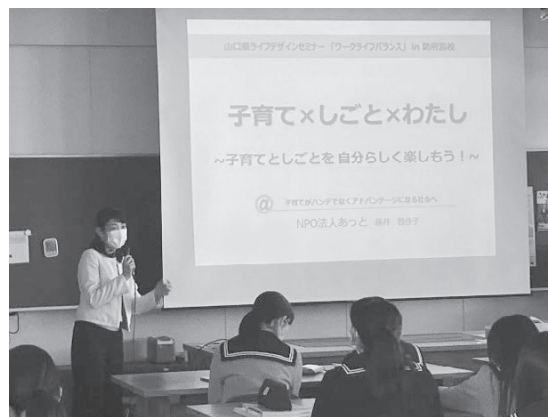
[ライフデザインセミナー：防府高等学校]