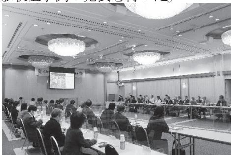
[やまぐち子育て連盟総会]

総会では、令和4年度の連盟の取組を説明したほか、子育て支援や子ども食堂の普及推進に関する取組事例の発表を行った。