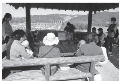
[第18回虹色ねっと子育て交流会]

コロナ禍で規模は縮小されたが、子育て支援者、関係機関・団体、事業所等との連携・協働により、地域コーディネーターの自主的・主体的な活動が各地域において展開された。