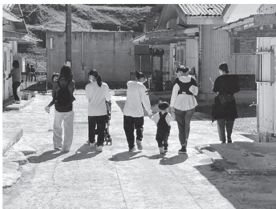
[乳幼児親子との触れ合い体験：山口農業高等学校]