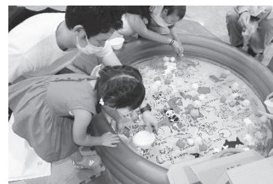
[親子で楽しめるブースも多数用意（下関市）]