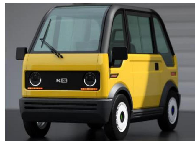
Minimum Mobility Concept

研究会当日、山口県産業技術センター入口にて、小型EV「 Minimum Mobility Concept 」の展示を行います。