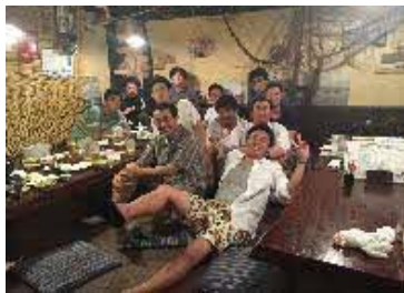
職場の懇親会の様子