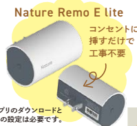
専用アプリのダウンロードとWi-Fiの設定は必要です。

今回貸出す「Nature Remo E lite」は、簡単に家庭に導入できる電力モニタリングシステムです。専用アプリをダウンロードすることで、家庭の消費電力量をリアルタイムにスマートフォンなどでいつでもどこでもチェックできて、家電の消し忘れも一目瞭然。コンパクトサイズでご自宅のコンセントに差し込むだけでご使用いただけます。