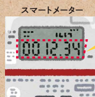
スマートメーター