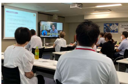
あいサポーター研修

盛りだくさんな内容の中でも、受講者の方々が実際に体験を通して「障がいと言っても多種多様で一律でないことを改めて知り、考えさせられた」「目をふさいだ状態での文字の記入、相手に伝わるように話しかけることの難しさを知った」など、「気づきが得られた」ことが、一番の収穫でしたと話されていました。