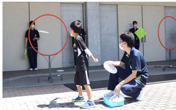
フライングディスク体験