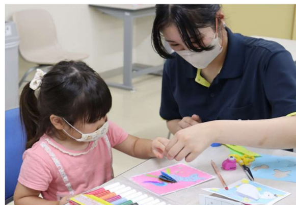
ポップアップカードをつくろう

あいサポート運動の取組が広がるよう、あいサポート企業・団体の活動状況やあいサポーター研修の取組事例などを紹介しています。皆様からの情報をお寄せください。