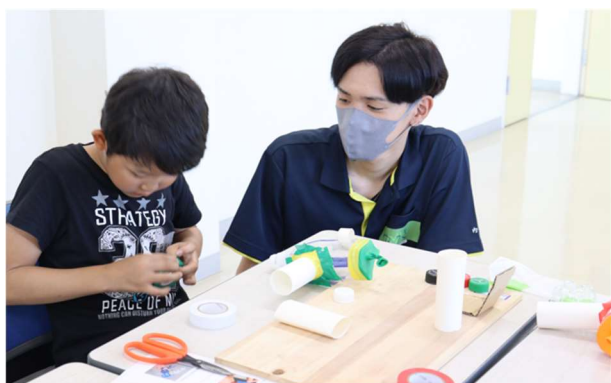
ペットボトルで空気砲をつくろう